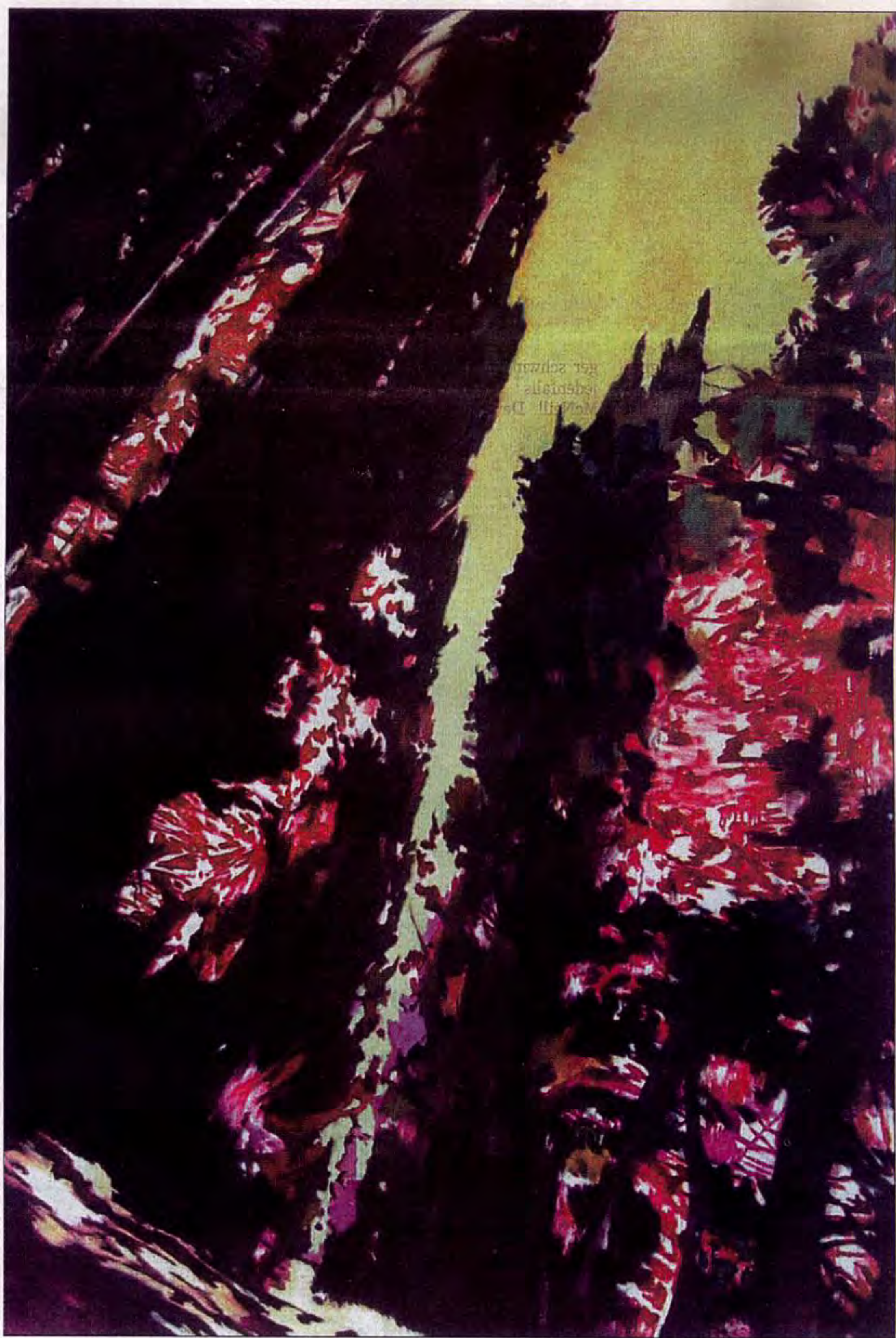
Aus der Serie "Timber Land" von Gisela Krohn in der Galerie Wittenbrink (M)